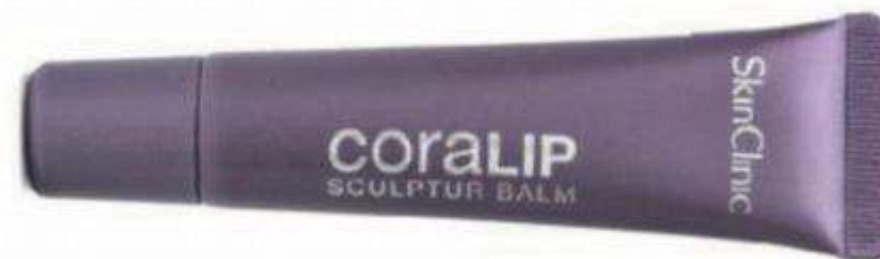
Tratamiento para los labios y la zona perioral Coralip de SkinClinic (17,50 €).