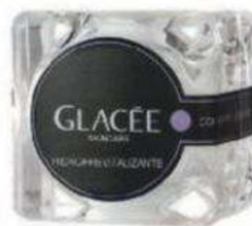
Crema Hidrorrevitalizante con factores de crecimiento de Glacée (86,90 €).