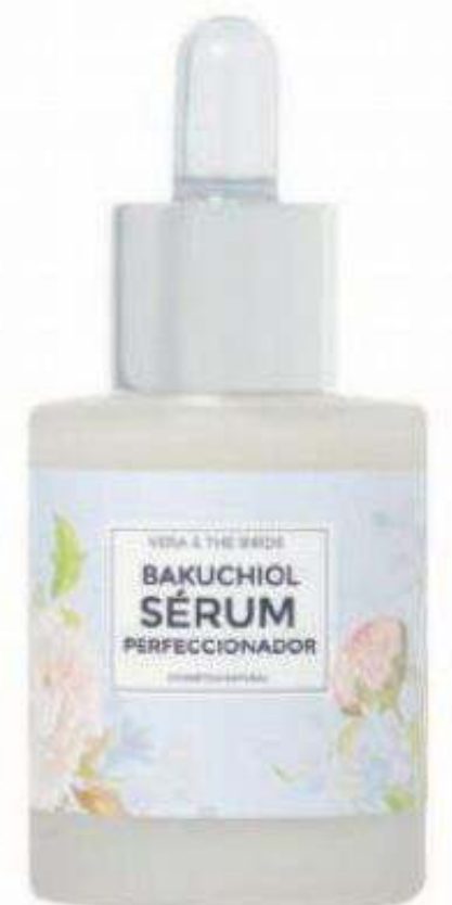
Sérum nocturno perfeccionador con bakuchiol de Vera & the Birds (35 €).