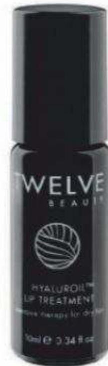
Elixir Black Baccara con oro y vitamina C de Miriam Quevedo (185 €). A la izda., aceite para labios Hyaluroil Lip Treatment de Twelve Beauty (36 €).