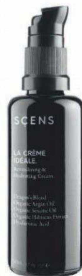
La Crème Idéale con aceite de argán, extracto de hibisco y ácido hialurónico de Scens (68 €).