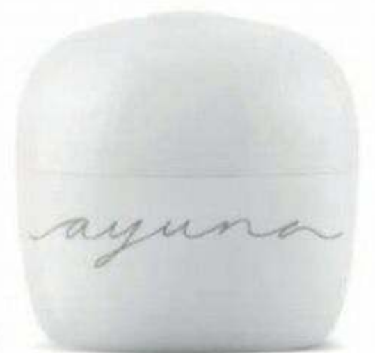
Tratamiento rejuvenecedor con fitopéptidos y plasma rico en cultivos vegetales celulares de Ayuna (212 €).