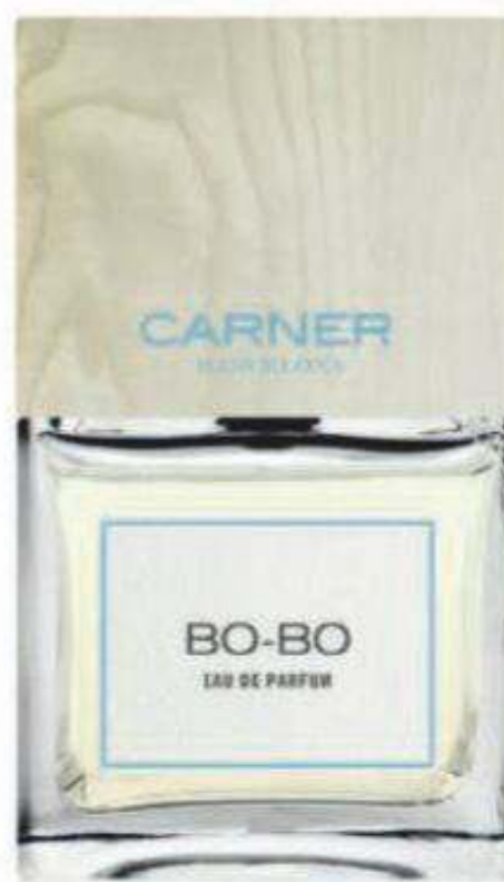
Fresca y cítrica, la fragancia Bo-Bo captura la esencia del Mediterráneo de Carner Barcelona (150 €, 100 ml).