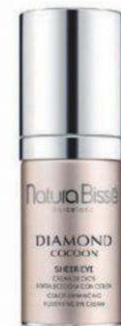
Contorno de ojos con color Diamond Cocoon Sheer Eye de Natura Bissé (121,50 €).

Nuevas o míticas, estas marcas españolas destacan.