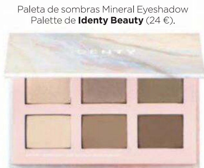
Paleta de sombras Mineral Eyeshadow Palette de Identy Beauty (24 €).